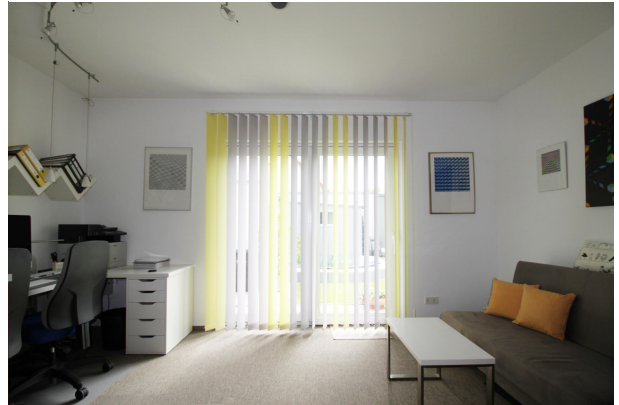
Büro und Gästezimmer im Erdgeschoss