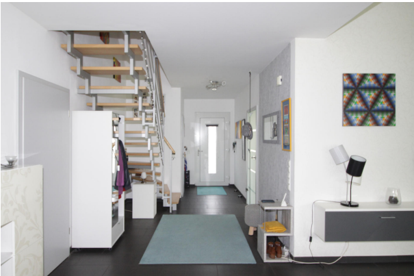
Flurbereich im Erdgeschoss