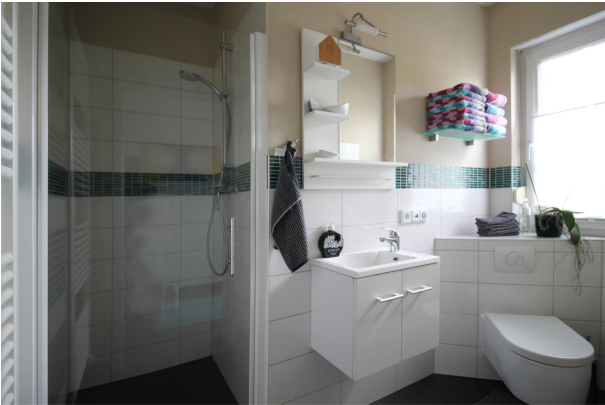
Gäste WC mit Dusche