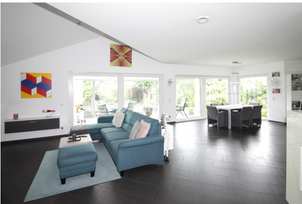
Wohnzimmer und Esszimmer